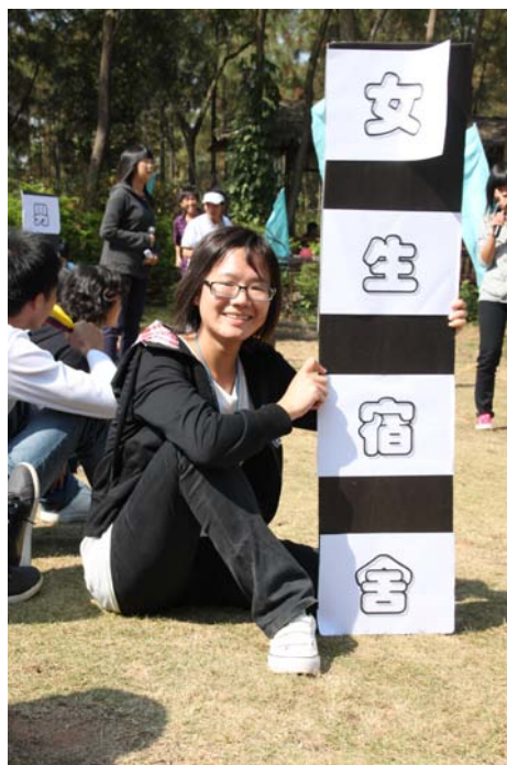
图学委秋游演出小品道具

精心准备的节目表演，香气喷喷的小组烧烤，趣味横生的水上活动，还有最后的合影留念……每一个环节，每一张照片，都真实地记录了同学