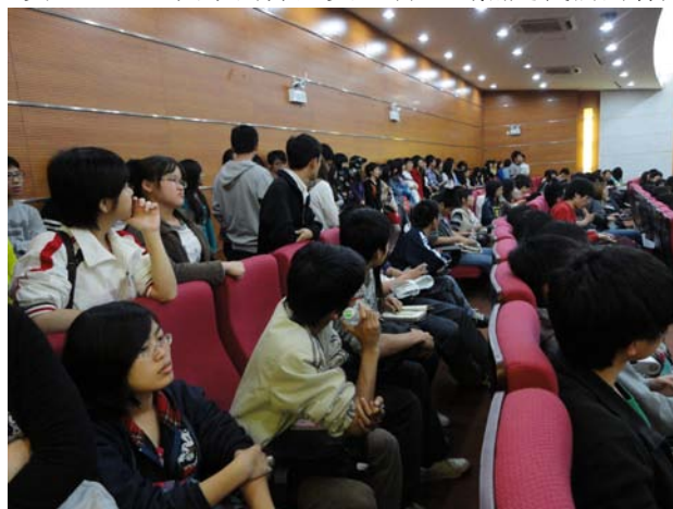
清风讲座火爆场面