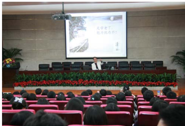
清风讲座座无虚席

清风： 这个问题问得很好。红颜祸水让人想到另外一个词——红颜薄命。与其说她们是红颜祸水，不如说红颜薄命。为什么会有红颜祸水这种说法，事实上牵涉到中国传统文化中男权文化的问题。我们的历史一直记录着男权文化的历史。有文字记载以来，我们的话语权就掌握在男人手中。所以在历史记载中，我们男人把亡国之责不加分析地都推给了女人。假如不是杨贵妃我们唐