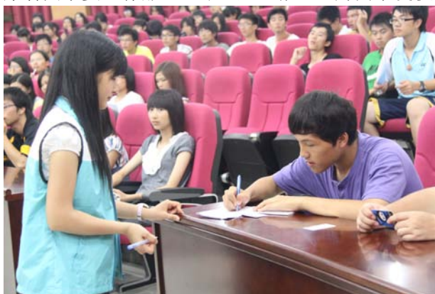
志愿者同学为会议服务

可以说，我们志愿者服务队，我们整个图学委，都在积极努力把图学委打造成温暖的家园。图学委，加油！