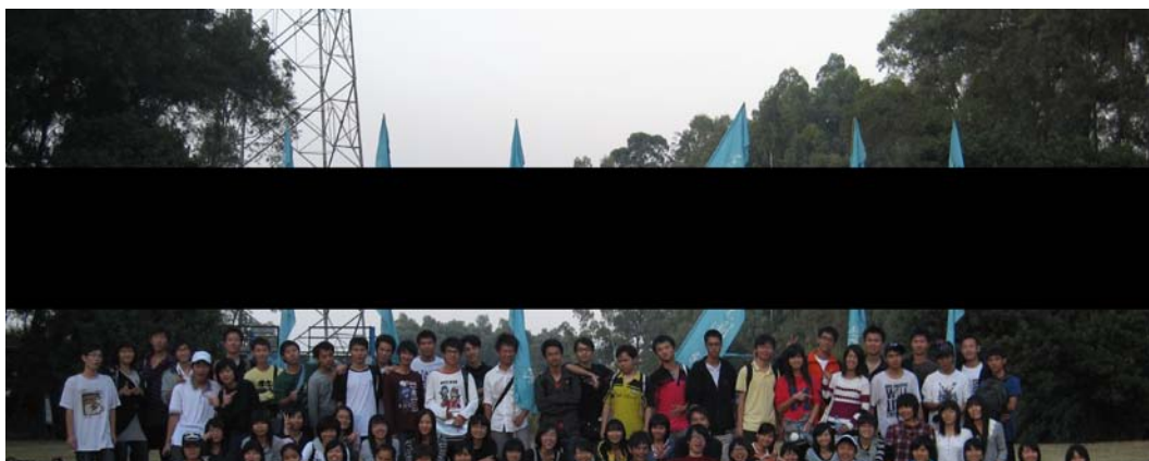
图学委秋游大合照

这天，秋高气爽，云淡风轻。早上8时30分，广商三水校区第三届图学委的同学们在图书馆门前聚集并出发前往乔鑫生态园。天气微凉，秋风吹落的枯叶铺满道路，我们坐在车上睡意朦胧。不到15分钟，就到达了生态园的门口。为了创设活跃的开场，秘书部和宣传部开展了抛绣球游戏，虽然大家都有些腼腆，在部长们的带领和主持人的感染下，气氛很快