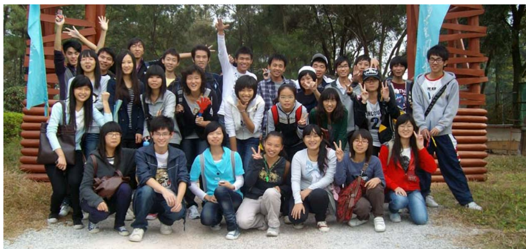
志愿者服务队秋游大合照