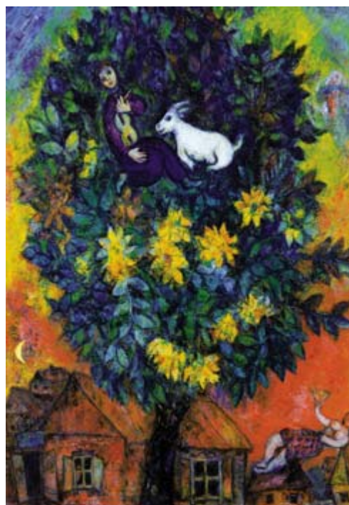
Autumn in the Village

Marc Chagall 马克·夏戈爾，1887-1985，超現實主義代表畫家，題材內容表現多為下意識的繪畫。1887年生于俄国，1910年到巴黎，成为法国画家。作品均为故乡俄国之风物，以“爱”为反覆描绘主题。 ——编者注